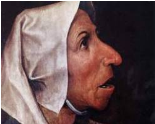
Facce da Minimum