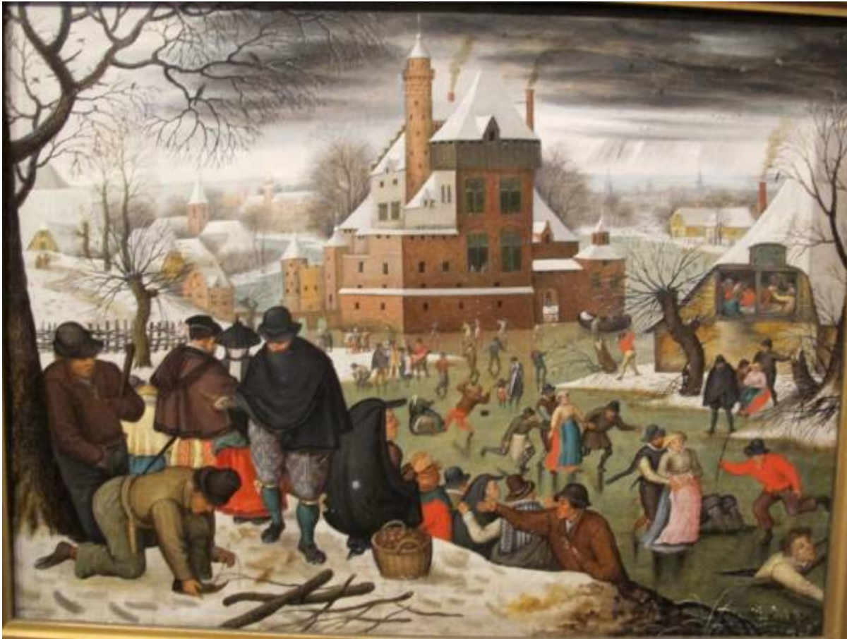
Bruegel il Giovane (osservate il cielo!)