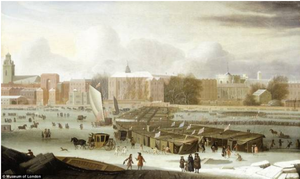
1684: il Tamigi ghiacciava al punto che ci passavano le carrozze. Il minimum di Maunder

Questo potrebbe essere un enorme motivo di preoccupazione. Infatti stiamo già assistendo a un aumento di figure meteorologiche instabili , a grandi inondazioni prolungate e oscillazioni improvvise della temperatura (sia verso l'alto che verso il basso), suggerendo tutto ciò che arriverà il momento che dovremo per forza adattarci. Questa teoria contrasta con quanto previsto dalla stragrande maggioranza della comunità scientifica che si occupa dei cambiamenti del clima. Quello che succederà nel futuro prossimo lo scopriremo già nei prossimi anni. Sicuramente occorrerà trovare delle soluzioni ad un clima che cambia ed al fatto che la popolazione umana aumenterà sempre di più.